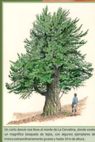
Un corto desvío nos lleva al monte de La Cervatina, donde existe un magnífico bosque de tejos, con algunos ejemplares de tronco extraordinariamente grueso y hasta 1.0 m de altura.