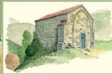
En la ermita de Pegarías se ofician algunas misas al año, pero ya no se acostumbra a celebrar la romería, con comida campestre incluida, que solía organizar año a año la parroquia de Lillo.