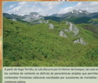
A partir de Vega Terrillo, la ruta discurre por el interior del bosque; tan solo en los cambios de vertiente se disfruta de panorámicas amplias que permiten contemplar frondosas cabeceras escoltadas por sucesiones de montañas y crestones calizos.