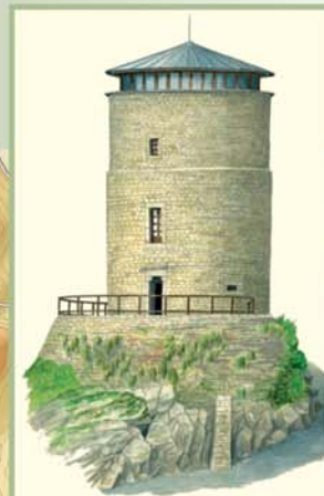
En la vieja torre medieval, se puede visitar la Casa del Parque del Torredón de Puebla de Lillo, donde se muestra una interesante exposición sobre el espacio protegido.