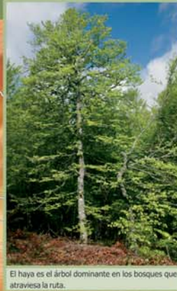
El haya es el árbol dominante en los bosques que atraviesa la ruta.